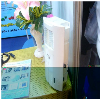
เครื่องฟอกอากาศใช้ภายในที่พักอาศัย