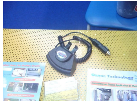
เครื่องฟอกอากาศใช้ภายในรถยนต์