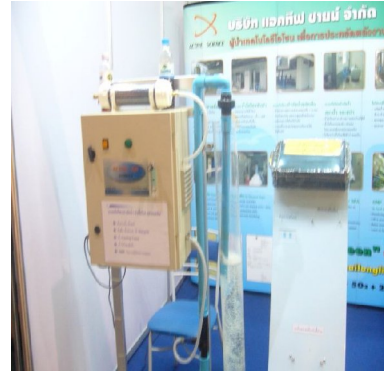
ชุดสารพัดการทำงานของเครื่องผลิตโอโซนที่ใช้ในอุตสาหกรรมต่างๆ